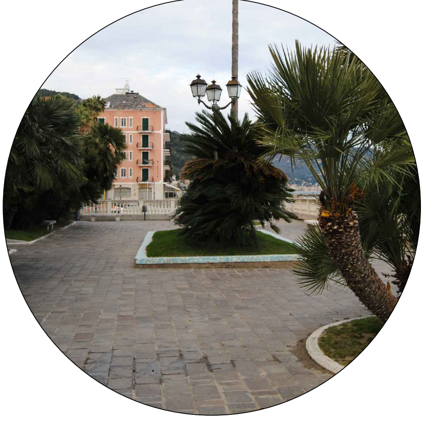
FOTO STATO ATTUALE - PASSEGGIATA LIBERO BADARO'

sinapsi_architettura :: workshop via Isoldi, 29 - 17021 Alasio sv ita tel/fax: +39 0182 613925 web: www.sinapsiarchitettura.com - mail: info@sinapsiarchitettura.com