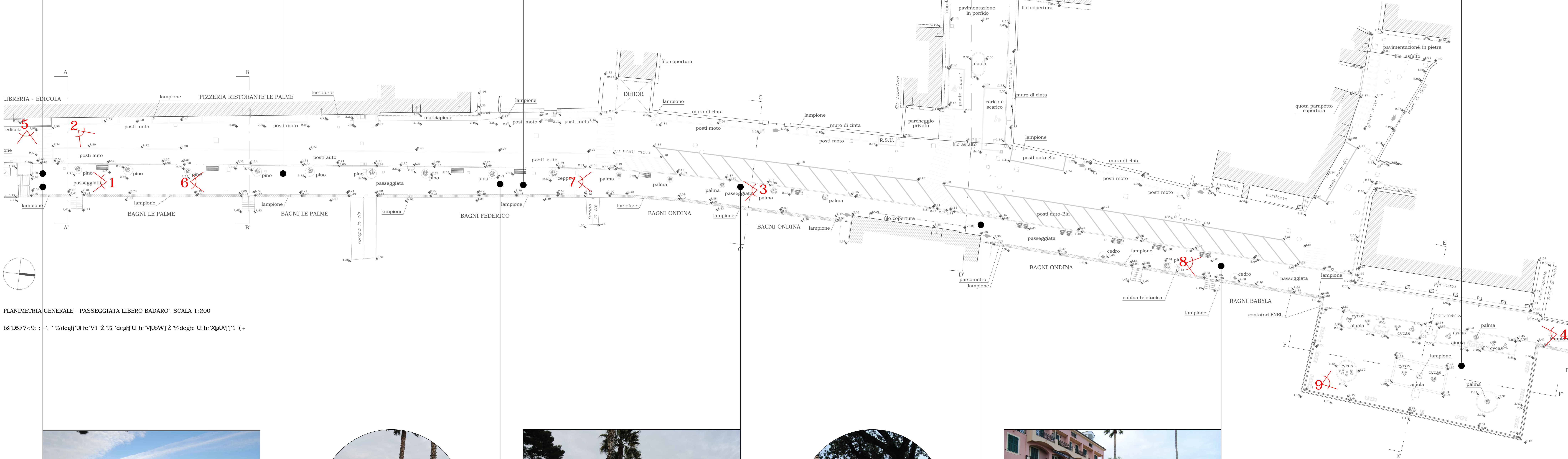
PLANIMETRIA GENERALE - PASSEGGIATA LIBERO BADARO' _SCALA 1:200

bs D5F7+9; ; =. " %degH U le V1 2 % degH U le V1bWJ2 % degH U le X1gM]1 ( +